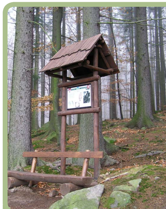
Naučná stezka Čerínek v chráněném území Přední skála

Přeji nejenom lidem, kteří zde žijí, ale především přírodě, aby srdce hory zůstalo zdravé. Filip Vláčil