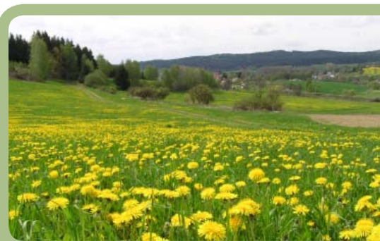
Okolí Dolní Cerekve – pohled na Přírodní park Čeřínek