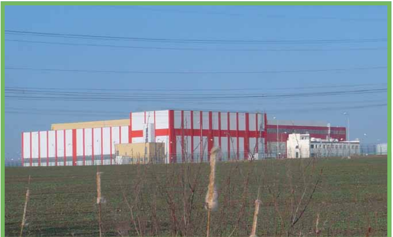
Sklad vyhořelého jaderného paliva v Temelíně.

Do skladů vyhořelé palivo neputuje rovnou z reaktoru. Nejprve musí být alespoň na pět let umístěno v bazénu vyhořelého paliva, neboť v něm ještě probíhá velké množství štěp-